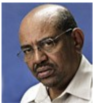
Omar al-Bashir

Un autre argument présenté dans le cas précis d’Omar al-Bashir est que l’on reproche à la CPI d’avoir envenimé la situation au Darfour. Selon plusieurs, la Cour aurait agi prématurément sans égard aux conséquences que pourrait avoir sur le sort des populations et sur l’accès humanitaire dans les zones de conflit le fait de viser spécifiquement un chef d’État en exercice. Le même reproche « d’aveuglement juridique » a été fait au sujet des accusations déposées contre Uhuru Kenyatta , président du Kenya en exercice. A contrario , le dépôt d’accusations contre l’ancien président ivoirien Laurent Gbagbo est venu accréditer la critique « apologiste » puisque Gbagbo a été accusé après avoir perdu le pouvoir, alors que son rival politique lui succédait à la présidence au terme d’une crise électorale (appuyant ainsi une apparente convergence d’intérêts avec les États).